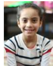
By: Kritika Kandel Loveland 4 th

The Omaha Henry Doorly Zoo and Aquarium is important because it protects animals so they can stay safe. Our zoo is also an important place because it's a great way to learn about animals. People come to the zoo so they can actually see the animals and learn the names of the animals, what they eat, where they live, and all kinds of other things. The zoo is fun and educational. Every day the zoo opens at 9 o'clock a.m. to 5 o'clock p.m. When you go to get your tickets children age 2 and under are free, children 3-11 are 12.95 dollars and adults 12 and over are 18.95 dollars. There are some really fun places in the zoo. There are some fun rides, cute and hairy animals, and a water park there. When I went to the zoo my family and I went on fun ride. I liked the cresol ride the best. We saw lots of interesting animals. My favorite animal we saw was the Polar and Black bear. The water park looked like fun but I didn't get to go. That's ok because I still had a great time. I LOVE the zoo and I know you will too.