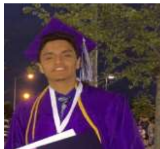
Sameep Neupane Central High School