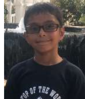
Art by: Sharish Shapkota