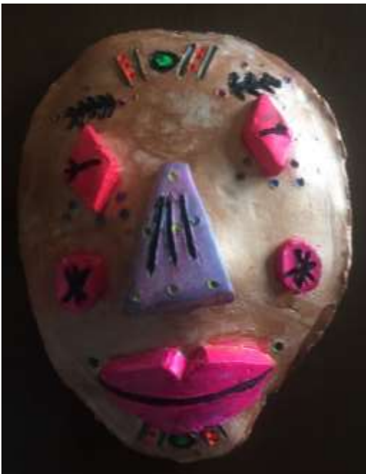
Art by: Shreeya Shapkota